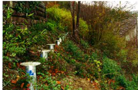
Schraubfundamente – die kostengünstige Alternative ohne Aushub, Beton und Wartezeit