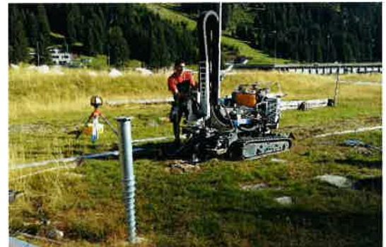
Kompakte Spezialgeräte erlauben den Einbau auch im Fels