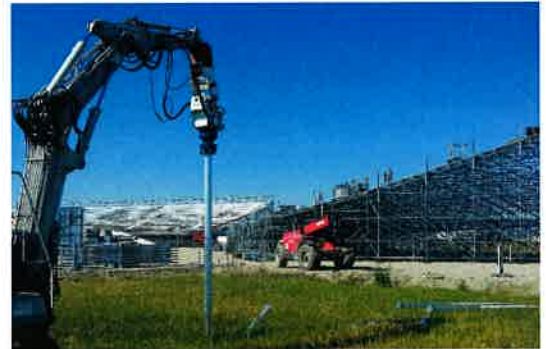
Auch für temporäre Installationen und hohe Lasten – Tribünenbau eidg. Schwingfest