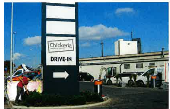
Werbe- und Verkehrstechnik – auch wenn es wenig Platz hat

«... unser Kunde ist begeistert. Wir haben – ohne Aushub und Erdbauarbeiten – das Sonnensegel am gleichen Tag fundiert und montiert. Dank den Schraubfundamenten konnten wir Schnittstellen, Koordinations- und Planungsaufwand reduzieren. Der Kunde freute sich zudem, dass keine Umgebungsarbeiten nötig waren.»