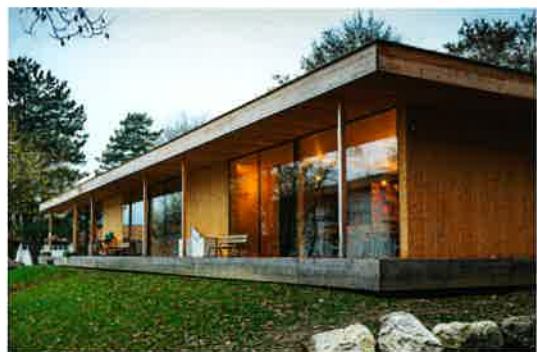
Schnell und sicher: Kindergarten in 2 Tagen fundiert.

«... mit Krinner Schraubfundamenten macht bauen Spass. Ich musste nicht einmal Schaufeln. Meine Terrasse, das Gartenhaus, die neue Pergola – einfach selbst fundiert.»