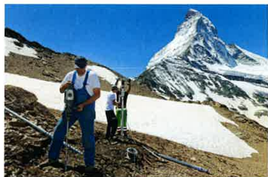
Einfach Eindrehen und ohne Wartezeit weiterbauen