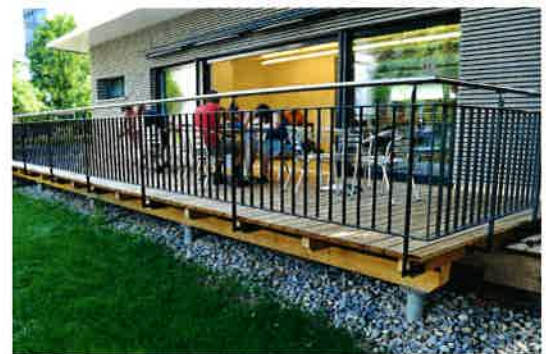
Holzbau – von Terrassen bis zu kompletten Wohnhäusern