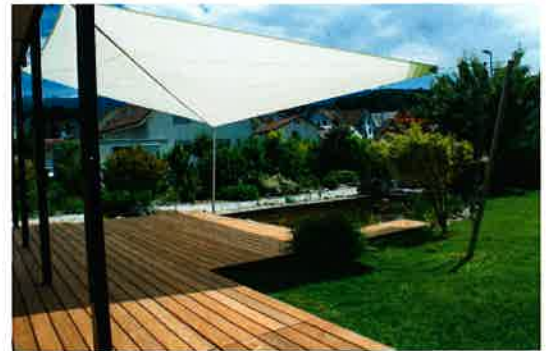
Gartenbau – schonender Einbau des Sonnensegels ohne Beschädigung des Geländeumfeldes