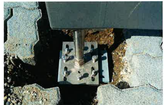
Vielfältige Befestigungsmöglichkeiten – Pfostenträger für SBB-Zweiradunterstände

«... basierend auf Belastungsversuchen erstellten wir mit Krinner das Fundationskonzept. Das Montageteam hat die Fundamente fristgerecht eingebaut – trotz teilweise felsigem Baugrund. Die Resultate der Fundamentprüfungen und die umfassende Bau-Dokumentation rechtfertigen unser Vertrauen in die Krinner Schraubfundamente.»